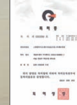
韓国発明特許 3 (2001)