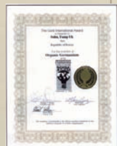
世界発明大会金賞 (1996)

日本で生産されている“化学合成有機ゲルマニウム”には化学構造性の問題により毒性があり安全とはいえません。“無機ゲルマニウム”は服用すると危険です。「オーガニック バイオ ゲルマニウム」は安全性が試験証明されています。アメリカFDA認証機関の急性毒性試験合格や、韓国内外のGLP機関で安全性試験をクリアしています。また、韓国KFDAから「健康機能食品として個別認定」を受けています。長期間服用しても安全で生体親和性に優れています。