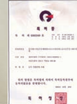
韓国発明特許 2 (2000)