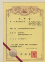
韓国発明特許 1 (1997)