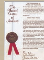
アメリカ発明特許 (1998)